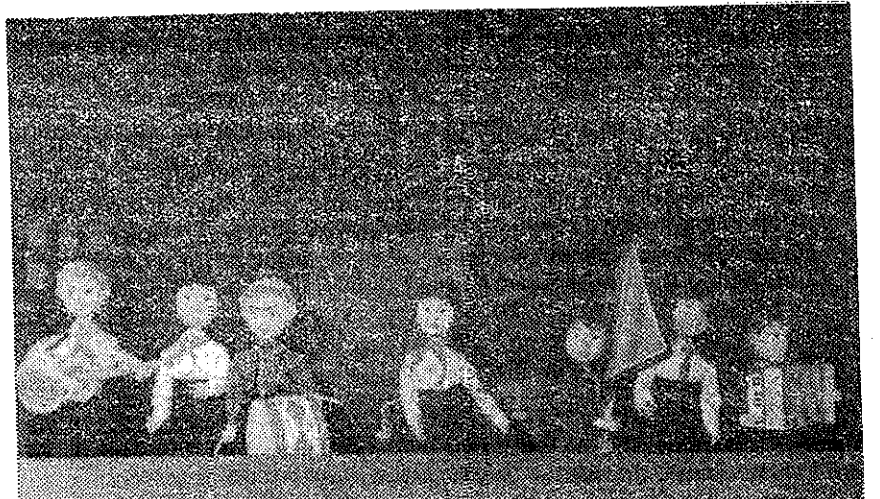
Pamje nga shfaqjet «Punë e dëfrim» dhe «Gracka» të Teatrit Qendror të Kukullave Tiranë.